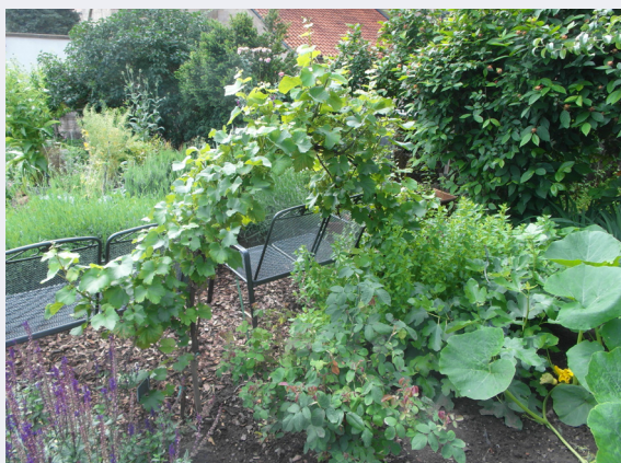
Chardonnay-Rebe im Klostergarten Otterberg Text: Bärbel Nittner

Ein Zitat lautete: „Qui bon vin boit, Dieu voit.“ / Schenkst du Guten ein, schaust du Gott im Wein.